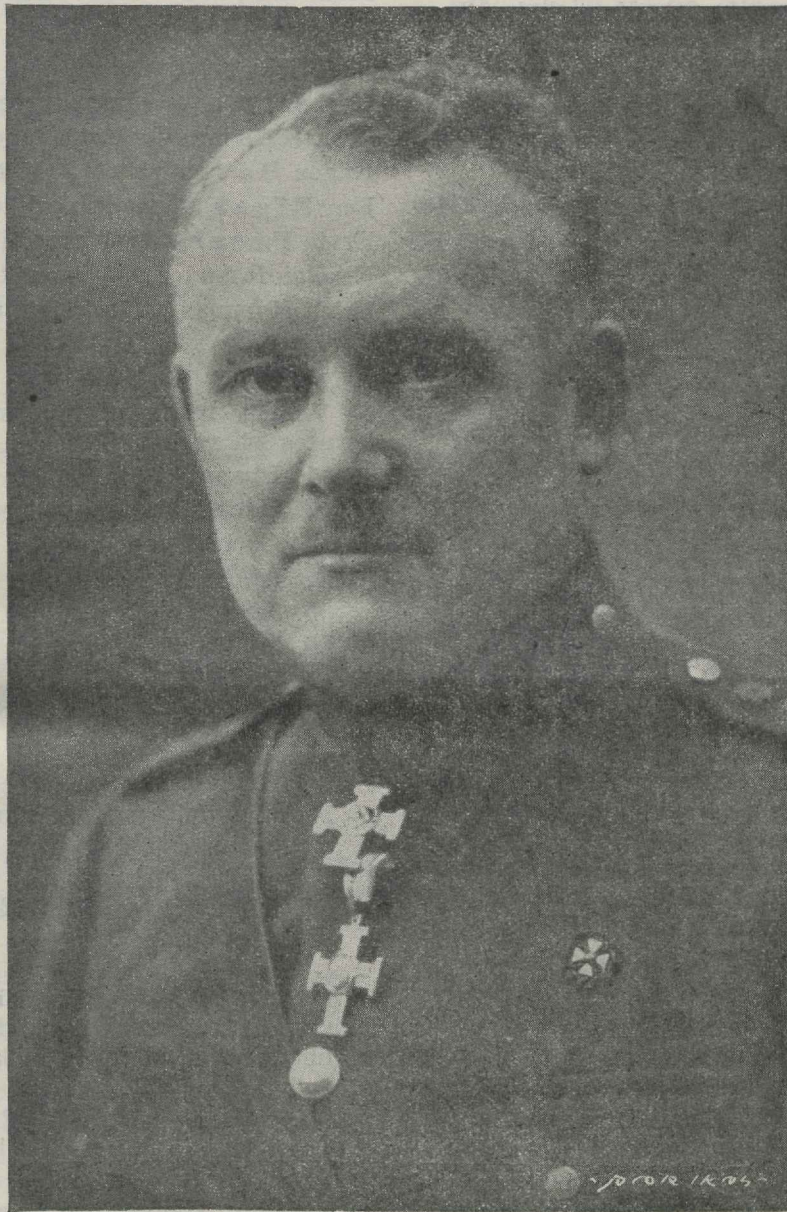
Sv. Ülemjuhataja kindral-leitnant J. Laidoner.