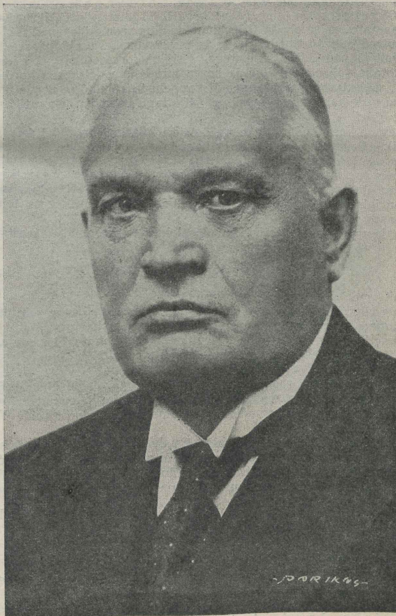
Vabariigi President K. P ä t s.

Sisu: 1) Kaitseliidu Ülema ringkiri; 2) Maleva pealiku käskkiri Nr. 4; 3) Maleva pealiku korrald. ja teadaanded; 4) Õppeala; 5) Kehaline kasvatus; 6) Allüksuste pealike korraldused; 7) Noorte Kotkaste ala; 8) Naiskodukaitse ala; 9) Kodutütarde ala.