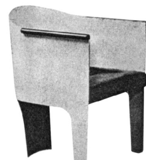
Painutatud vineerist lastemööbel.

Lisaks tavapärasele istemööblile toodeti veel laste pukktoole, koolipinke ja klapptoole. Klappmööbel oli ideaalne eksporditavaks, sest võttis transportimisel vähe ruumi. Klapptoolidest sai firma üks populaarsemaid eksporditavaks, mille järele oli nõudlust nii Euroopas, Lõuna-Ameerikas kui ka Indias.