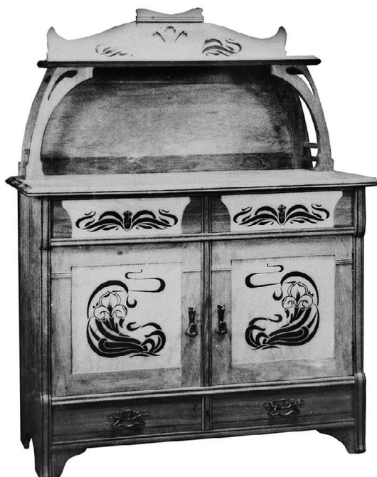
Juugendstiilis kummut nr 3478, mille põletustehnikas paneele kasutati ka juugendstiilis toolide valmistamisel.