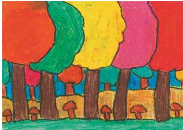
Ilona W., 7aastane.