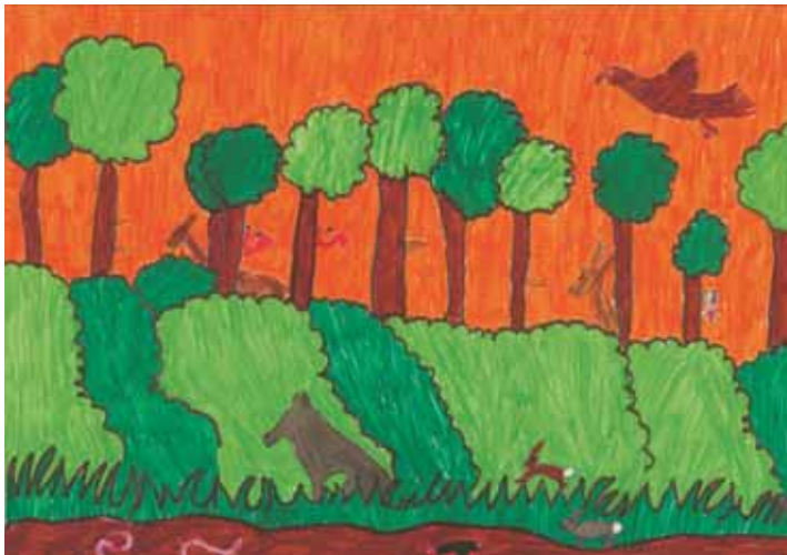
Violett B., 8aastane.