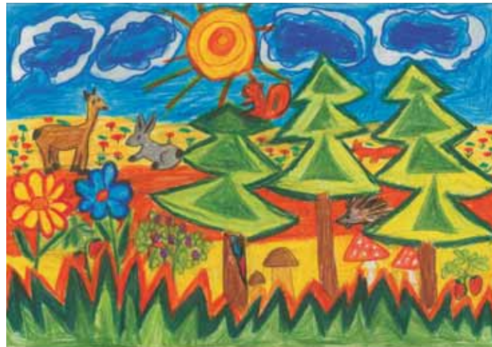
Maciej S., 3. klass.