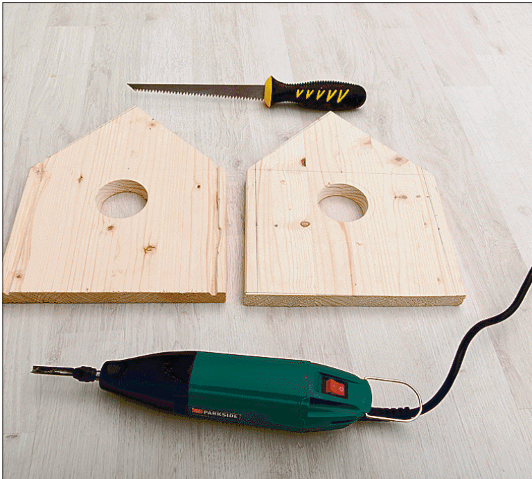
Saagige detailid välja ja lõigake otsaseintesse ümmargused avad. Süstage otsaseinte äärtesse, 5 mm kaugusele servast, 4 mm sügavused sooned, kuhu hiljem saate pleksiklaasi kinnitada. Lihvige väljapoole jäävad detailide servad liivapaberiga siledaks