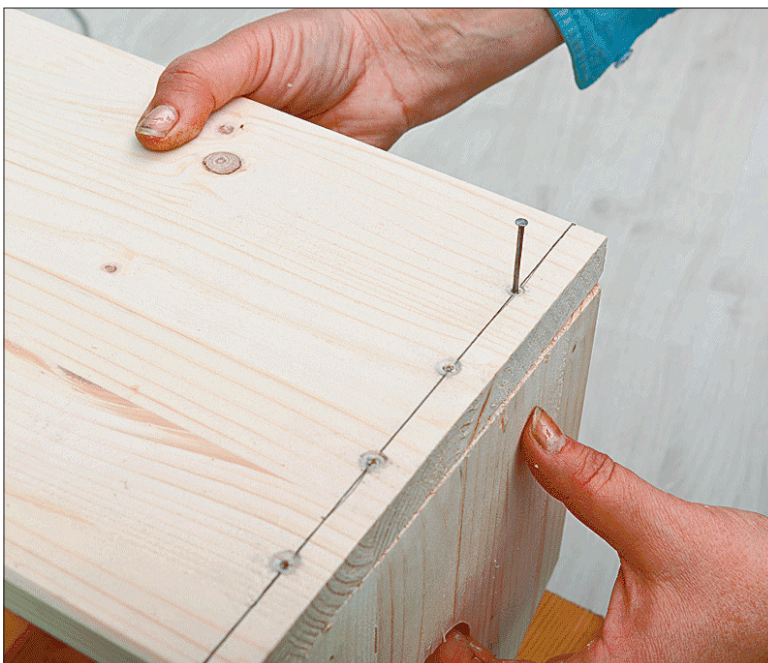
Kinnitage otsaseinad põhjale, märkides kruvide asukohad joonega.