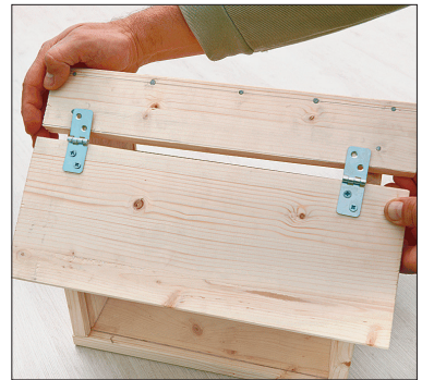
Nüüd tehke katuse valmis. Alustage sellest, et kinnitate katuseviilu külge teise viilu ülemise detaili. Naelutage detailid oma kohale.