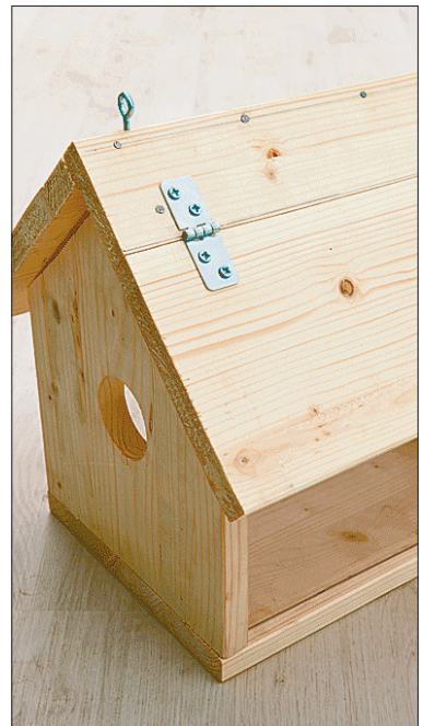
Kinnitage katusedetailide külge hinged ja veenduge, et hinged hakkavad korralikult käima.