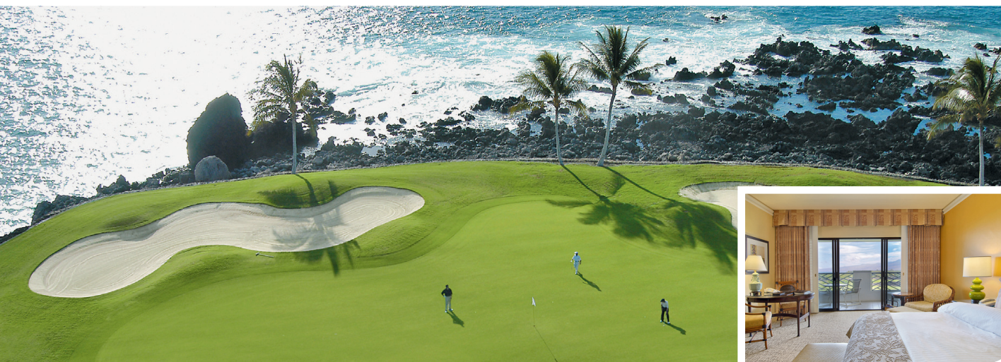
Hawaii mustale laavale lisavad värvinguid roheline muru ja sinine ookean. Paremalt üks 540 toast, milles raja lähedal majutada.

Hawaii – koht, mis on alati olnud maapealse paradiisi, igapäevase rannal tantsimise, lillevanikute ja suurte naeratuste sünonüüm, on teadajate seas kuulus ka oma võrratute golfiradade poolest. Ranniku ja vulkaanide vahelisele alale vormitud rajad on ühed greeniarmastajate lemmikud. 36auguline Fairmont Orchidi golfiala, mille eripäraks on kuumaastikulaadne ja kontrastse värvigammaga loodus, on sellel laiuskraadil kindlasti üks kõige hinnatumaid omasuguseid ning Fairmont Orchid Golf Clubi kaks rada, mis selle südamikku moodustavad, ei ole teistega võrreldavad. The South Course (18 auku par 72) kulgeb mööda laava poolt miljoneid aastaid tagasi kaevatud kanaleid, mille ääres on võimast visuaalset elamust pakkuvast mustava pinnasest kontrastis helesinised veed ja helerohelised aasad. Tänu iga augu ääres olevatele tiidele ja maastikule, mis nõuab väga häid oskuseid, sobib rada ka keskmise/kõrge händikäpiga mängijatele. Sama kaunis, ent teistsuguse keskkonnaga The North Course (18 auku par 72) laiub rohelisel, vesistest ohtudest pungil ja harva lamedal maastikul ning sobib iga händikäpiga mängijatele. Unustamatu elamuse tagab ka