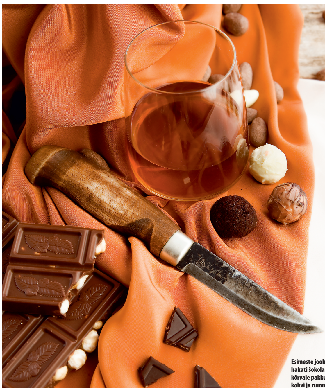
Esimeste jookidena hakati šokolaadi kõrvale pakkuma kohvi ja rummi.