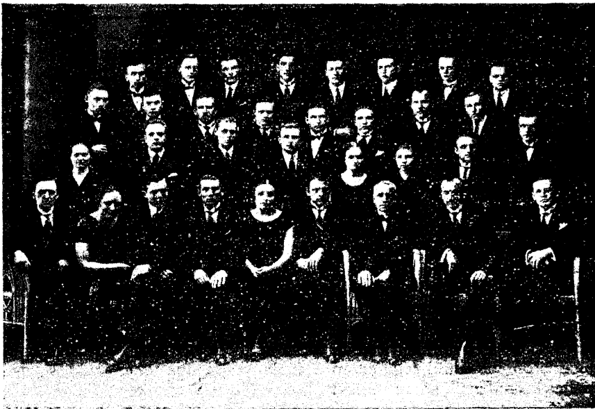
Ülesvõte seltsi 5. aastapäevalt.

mulikkudele, kõigile arusaadavatele alustele, ja kõike seda, mis sellesse „teaduslikku“ raami ei mahu, kõrvaldama kui legendi, müütost, fantaasiategevuse avaldust, subjektiivset illusiooni, rumalust. Näiteks peab ajalugu, mis püüab kõike immanentselt seletada, igasugust transsendentset faktorit eitama. Nõnde peab ka looduste adus looduse kui isoleeritud terviku peale vaatama ja igasuguseid põhjusi otsima ainult siit ilmast.