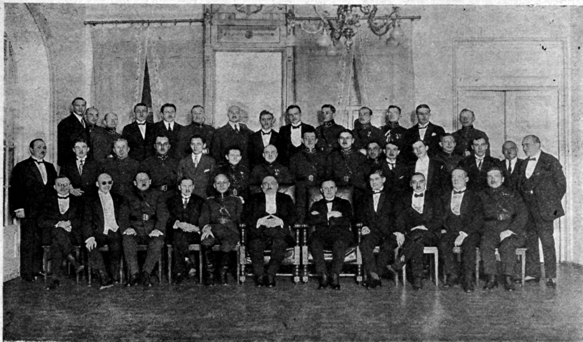
1 Eesti rügemendi (Tallinn, 12.IV.17 — Haapsalu 13.IV.18) ohwitseride kogu 7. aastapäew, 16. aprillil 1924 a., Tallinnas, Ohwitseride Keskkogu kasiinos.

tada on — 1. Eesti rügement, kelle laiali-saatmiseks aga ka juba ettevalmistusi tehtawat. Nimelt oli Eesti töörahwa ja sõjawäe nõukogu 20. jaanuaril otsustanud Eesti wäeosi likwideerida ja punakaarti asemele organiseerima hakata. Oli asutud juba tegelikkude sammude juure. Ülemkomitee tegewus suruti põranda alla, 3. rügement oli lagunenu, Eesti diwiisi staap üle wõetud. 1, 2, 4 ja tagawara rügement ning kahurwäe brigaad püsisid weel edasi, kuid igaüks oma ette.