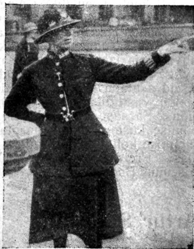
Naispolitseinik Londonis wõõrastele juhatust andmas.

Just siin aga avaneb naispolitseile väga laialdane tegevuspõld, sellele naispolitseile, kelle ellukutsumine Inglismaal ja inglaste mõju all Köln'is on kõige paremaid tagajärgi annud võrdlemisi lühikesel tegevusajal jooksul. Muu seas võimaldavad naispolitsei poolt tarvitusele võetud politseilised ning ühenduses sellega ka hoolekandelised ning tervishoidlised abinõud kõige edukamalt suguhai-guste laialilaotamise vastu võidelda. Naispolitseinikud, kes tarviliselt ette valmistatud sotsiaalse töö alal ning kellel küllaldaselt kogemusi hoolekandes hädaohtu sattunud inimeste, eriti naiste ja laste suhtes, oskavad ka kõige käidavamatel täna-