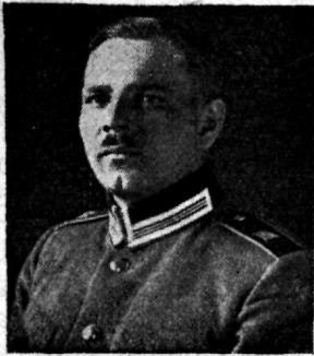
Tartu linna politseiülem Artur Stolzen †.

Riia piirivalve rügementi, kus teenis kompanii ülemana. 18. apr. 1916. a. ülendati alamleitnandiks, 13. okt. 1916. a. leitnandiks, 15. jaan. 1917. a. alamkapteniiks ja 29. märtsil 1918. a. kapteniiks. Teenis 1-ses Eesti jalaväe polgus alates 18. maist 1917, 3-das polgus 18. okt. 1917 ja ratsapolgus 10. dets. 1917, kust veebruarikuul 1918. a. sõjaväeteenistusest lahkus.