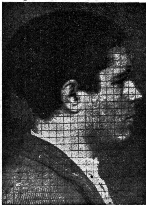
Joon. nr. 2.

jude intensiivsust ning kasutan selle intensiivsuse väljendamiseks ning edasiandmiseks numbreid, mida võib telegraafi, telefoni ja raadio teel edasi anda. Vastuvõtte kohas tähendatakse siis numbrid üles ning viiakse graafiliselt üle vastavasse valguse ehk varjuintensiivsusse. Kõik see töö ise sünnib järgmiselt: näopildi valguse ja varjude varjundid jagatakse seitsmesse liiki, nagu seda võib näha esimesel joonistusel. Tabel algab puhtvalguga ja lõpeb sügavmustaga. Et pilti edasi anda, asetatakse viimane klaasist plaadi alla, mille peal on täisnurgetest joontest koosnev võrk; jooned on üksteisest 3 mm.eemal. Selle tõttu paistab nagu oleks pilt jaotatud suure arvu väikestesse täisruutudesse. Iga ruudu kohta teeb edasisaatja ametnik kõige pealt kindlaks, mis valguse kraad temal on. See valguse kindlaksmääramine algab esimese täisruuduga pahemat kätt esimeses ruutude reas, läheb edasi paremat kätt, mille juures ikka üks ruut teise järele uurimise alla võetakse. Kui esimene ruutude rida läbi on, alatakse tööd järgmises reas jällegi pahemalt poolt paremale. Kuidas pilt sarnase täisruutude