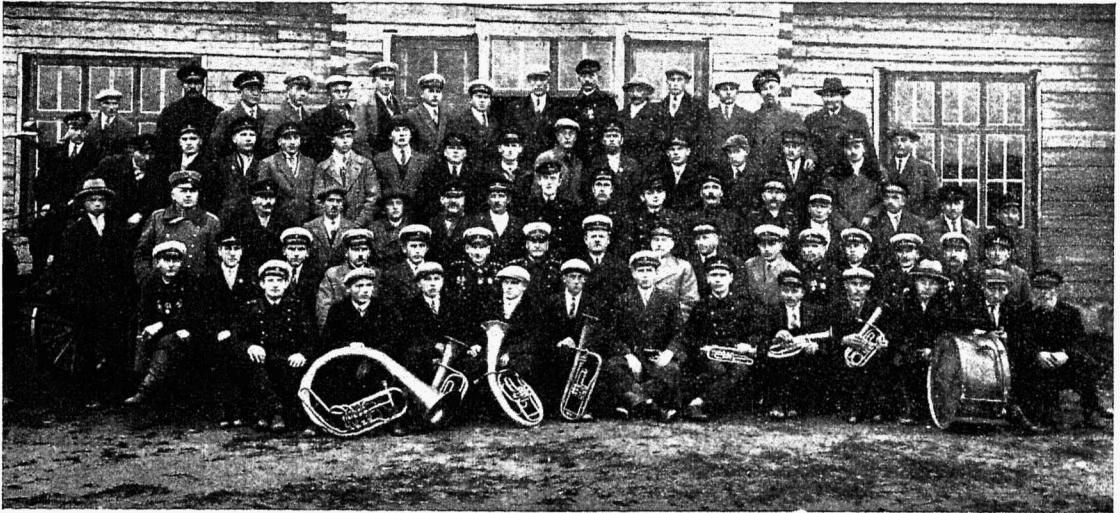
Puka tuletõrje kursusest osavõtjad.