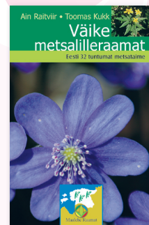
Toomas Kukk, Ain Raitviir VÄIKE METSALILLERAAMAT Eesti 32 tuntumat metsataime 80 lk, kilekaaned, taskuformaad

Tuntud taimed kirjelduse, põnevate faktide ja äratundmist hõlbustava fotoga.