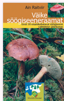
Ain Raitviir VÄIKE SÖÖGISEENERAAMAT 72 lk, kilekaaned, taskuformaad

30 meie metsade parimat söögiseent foto ja täpse kirjeldusega.