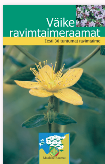
VÄIKE RAVIMTAIMERAAMAT Eesti 36 tuntumat ravimtaime