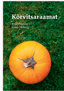
Priit Põldma, Toivo Niiberg KÕRVITSARAAMAT 208 lk, pehme köide, värvitahvlid

Raamat annab ülevaate kõrvitsaliste sugukonnast, kuhu kuulub üle 800 liigi 119 perekonnast. Kõrvitsaliste viili on üks taimerigi suurimaid, kaaludes kuni 300 kg ja rohkemgi. Samas on väiksemad viljad rusikasuurused.